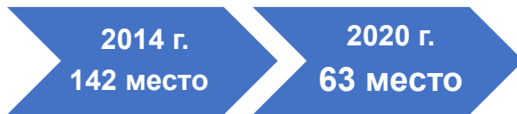
Рисунок 2. Прогресс Индии в рейтинге EASE OF DOING BUSINESS ВСЕМИРНОГО БАНКА

Источник: составлено авторами на основе открытых источников 48