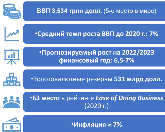
Рисунок 1. Современная Индия в цифрах